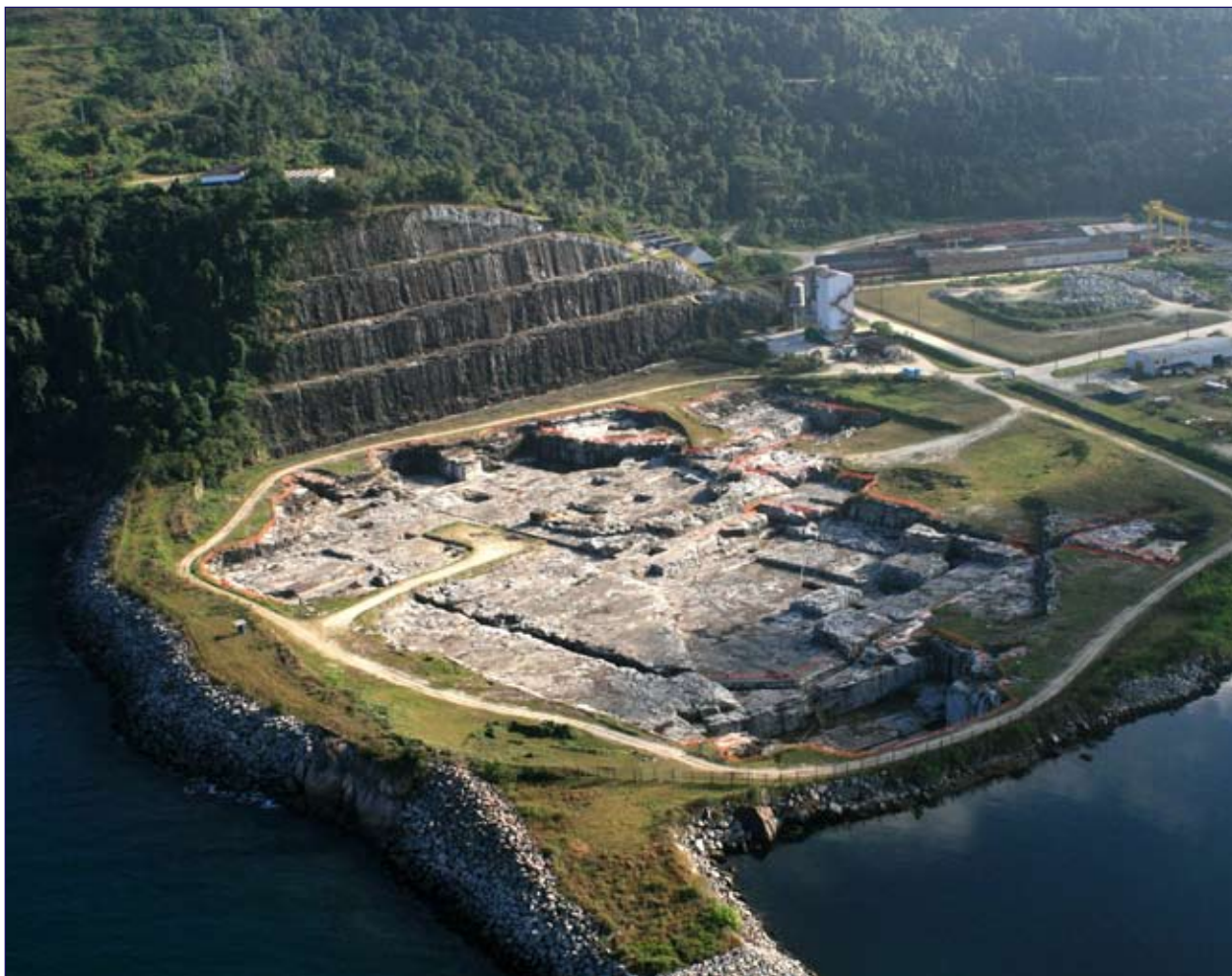
Local onde será construída Angra 3

Operadora das duas usinas nucleares do País, a Eletrobras Eletronuclear recebeu autorização definitiva para a construção de Angra 3. Trata-se de uma obra de grandes proporções e com evidente relevância ambiental (já que utiliza energia limpa, com baixa emissão de carbono) e social para o Brasil — e, em particular, para a região de Angra dos Reis, onde estará localizada a Unidade 3 da Central Nuclear Almirante Álvaro Alberto. Estima-se a geração de até nove mil empregos diretos e 15 mil indiretos durante toda a construção; na fase de operação, a previsão é de 500 empregos diretos.